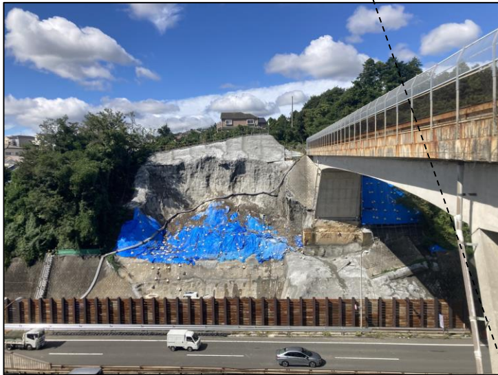
応急復旧工事 令和5年10月10日撮影