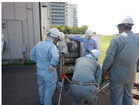
排水ポンプパッケージ 訓練状況