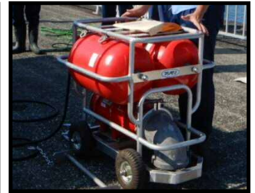
小型移動式排水設備 (2.5m 3 /min)