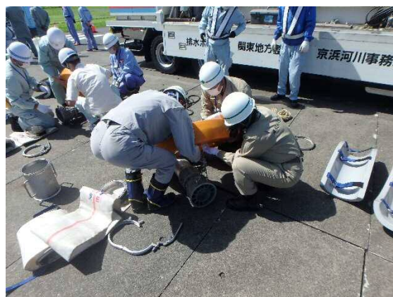
排水ポンプ車 排水ポンプ組立