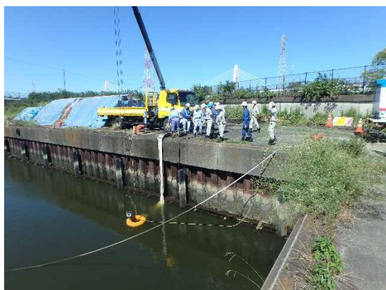
排水ポンプ車 実排水状況