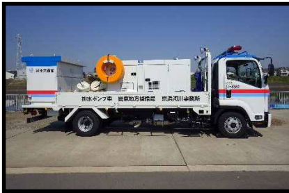
排水ポンプ車 (30m 3 /min)