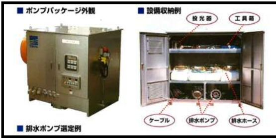
排水ポンプパッケージ (10m 3 /min)