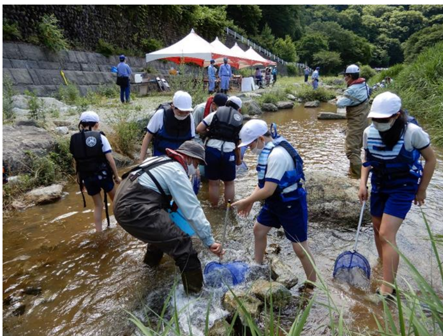
令和4年7月の水生生物調査の実施状況