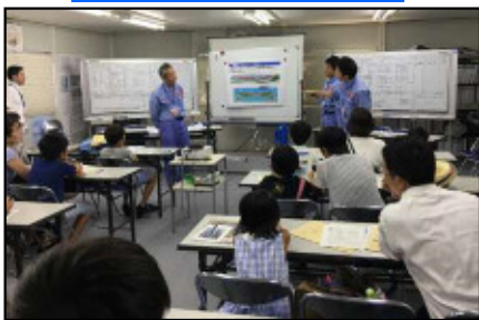
紙芝居による トンネルのお話