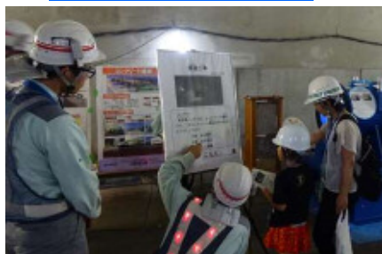
トンネルに関する クイズ