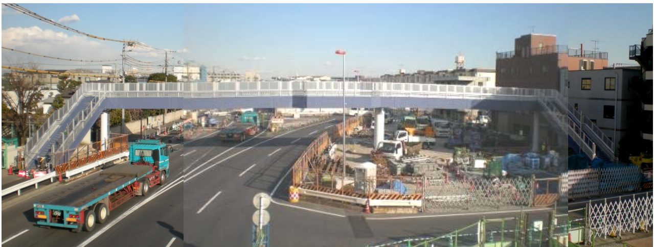
【大師方面より 平成23年1月27日撮影】