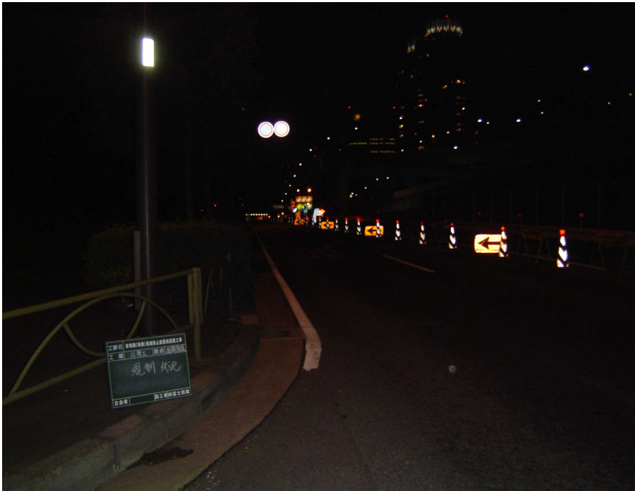
【写真撮影①】有明橋下り線 追越1車線規制状況