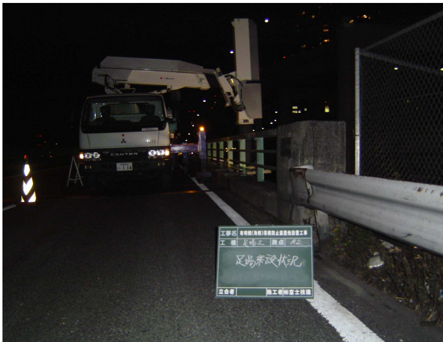
【写真撮影②】足場架設状況（A2橋台）