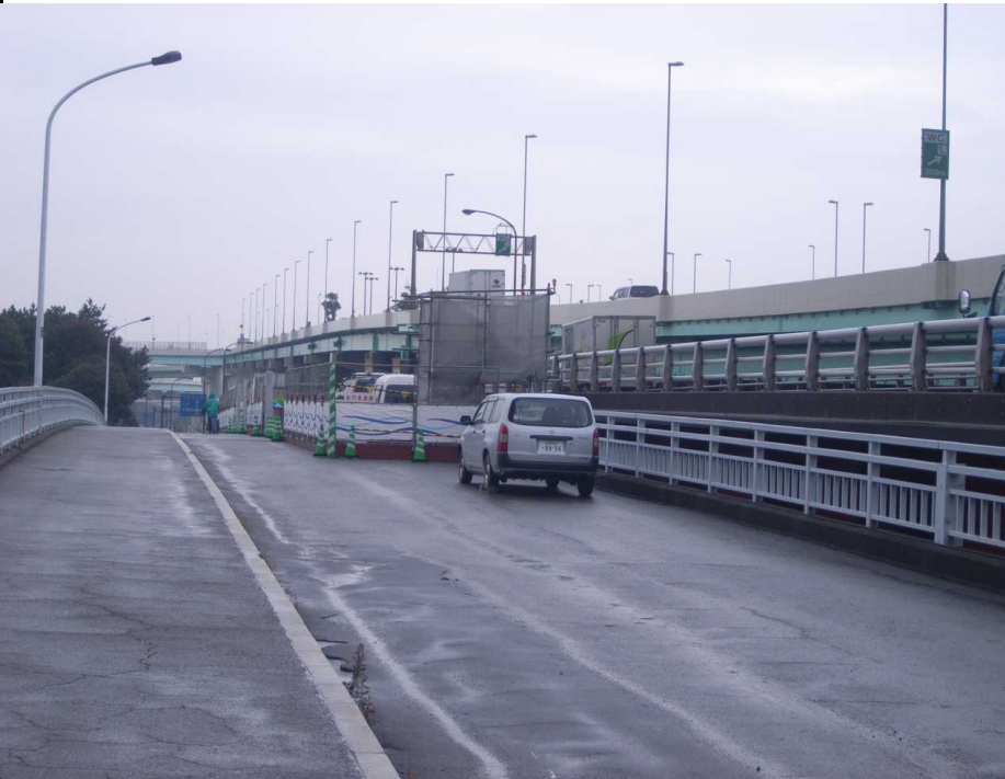
【写真撮影①】 P2, P3橋脚の昇降設備