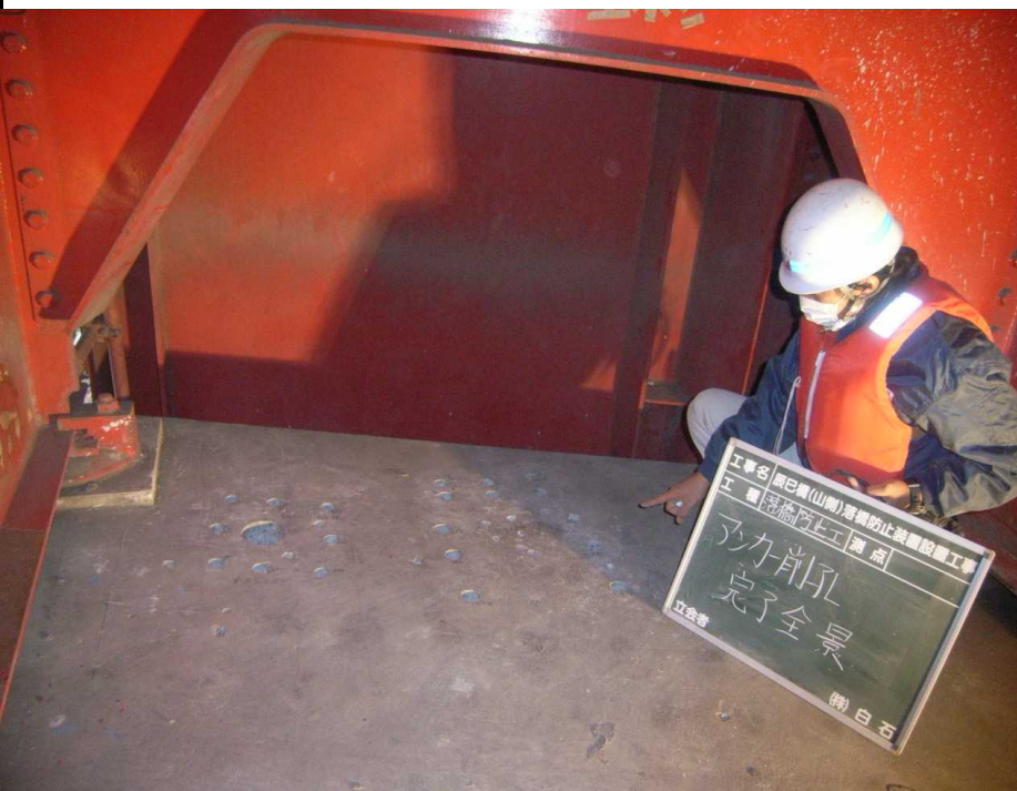
【写真撮影②】 アンカー削孔完了箇所の全景