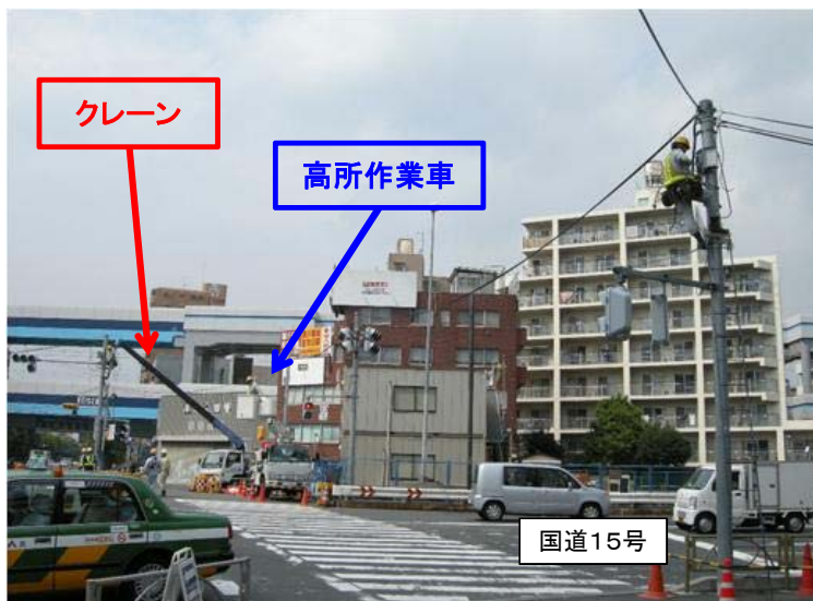
切廻し道路工 交通信号機移設施工状況

写真③は、南蒲田交差点で昼間交通信号機の取付とケーブルの配線している状況です。高いところでの作業なので、梯子や高所作業車を使用して作業を行います。信号機の取り外しにはクレーンを使用します。