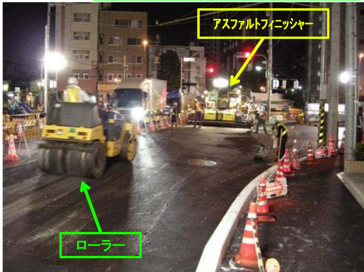
切廻し道路工 夜間舗装施工状況

写真②は旧多摩堤通りの京浜急行線踏切から京急蒲田駅前交差点迄の舗装工事の状況です。アスファルトフィニッシャーと呼ばれる機械で敷き均し、ローラーで締め固めを行っています。