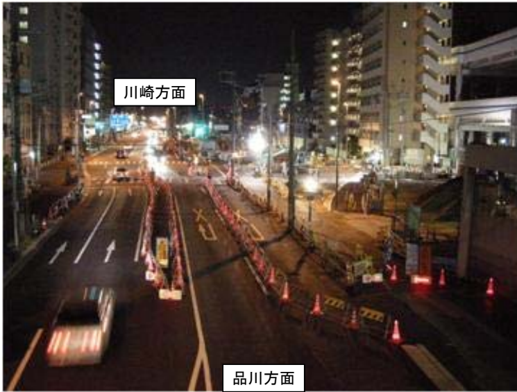
切廻し道路工 夜間道路規制状況