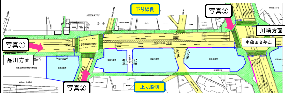
【10月10日までの国道の形態】

10月11日に国道15号上り車線を下丸子側へ移動し、上下線を分離する道路切廻しを行います。