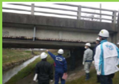
【地方公共団体管理橋梁への技術的支援】