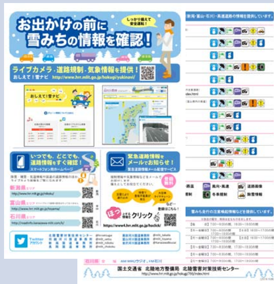
【道路利用者への情報発信】