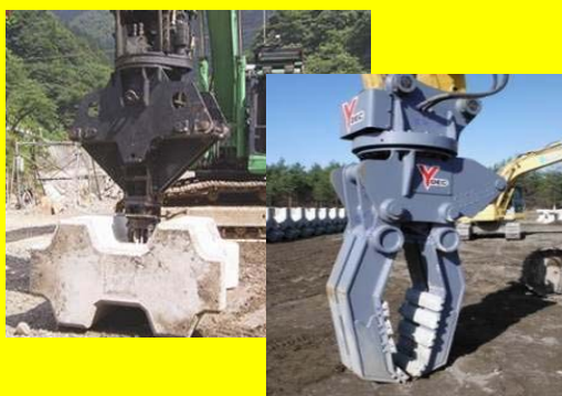
【無人化施工に関する検討】