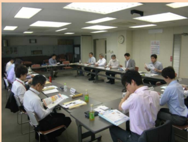
【地方公共団体等との意見交換】