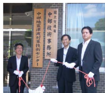
【技術センター開所式】 (上)北陸、(下)中部