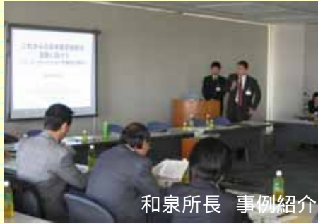
和泉所長 事例紹介