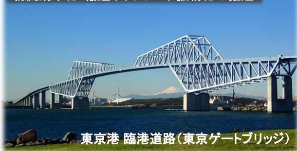
東京港 臨港道路(東京ゲートブリッジ)