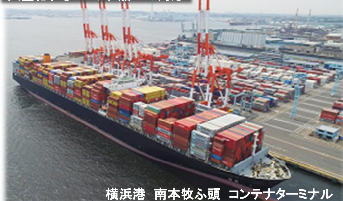
横浜港 南本牧ふ頭 コンテナターミナル