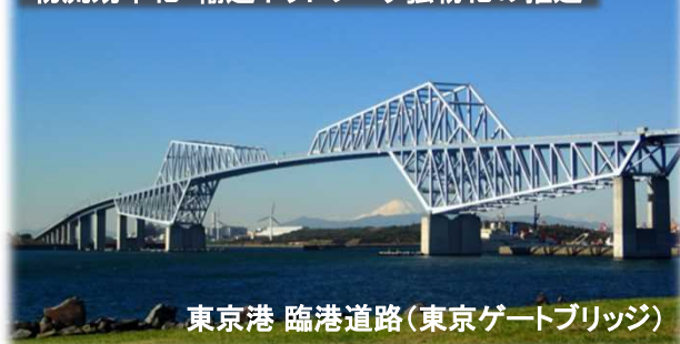
東京港 臨港道路(東京ゲートブリッジ)