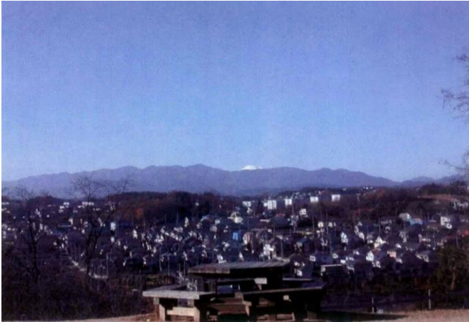
都立小山田緑地本園みはらし広場