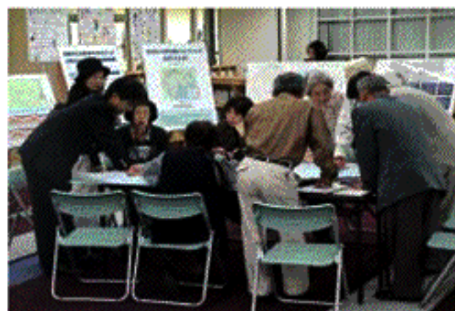
来場者との応答の様子（10月18日）