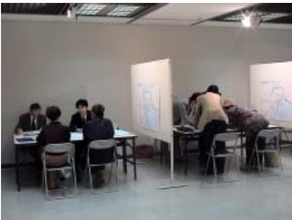
相談コーナーの様子(10月25日)

意見を聞くばかりではない 同様の意見の多い順に整理ものを示して意見を聞くべきだ。