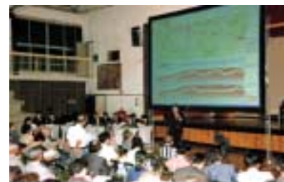
計画のたたき台説明会の模様