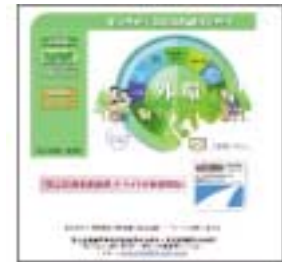
外環ホームページ