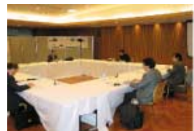
第2回東京環状道路有識者委員会の審議の模様