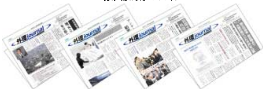
発行・配布した広報紙(外環ジャーナル)