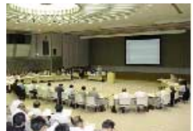
第5回PI外環沿線協議会の模様