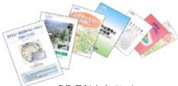
発行・配布したパンフレット