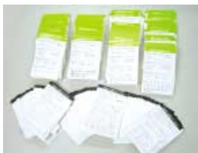
寄せられたハガキ