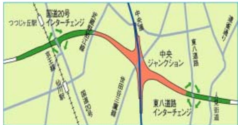
<国道20号インターチェンジ・東八道路インターチェンジ>