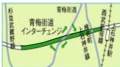
<青梅街道インターチェンジ>