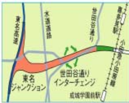
<世田谷通りインターチェンジ>