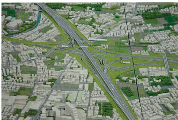
▲中央ジャンクション(仮称)周辺の立体模型