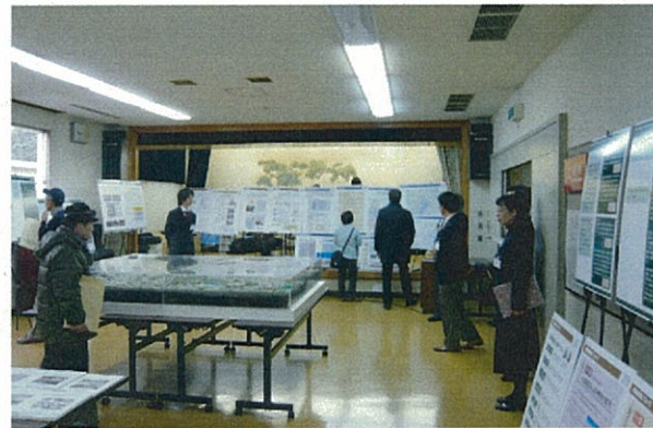
▲みなさんからのご相談やご質問には、担当者が個々に対応致します