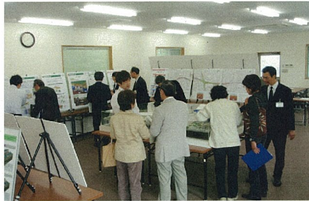
▲みなさんからのご相談やご質問には、担当者が個々に対応致します