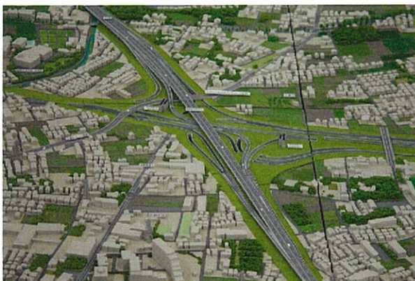
▲中央ジャンクション(仮称)周辺の立体模型