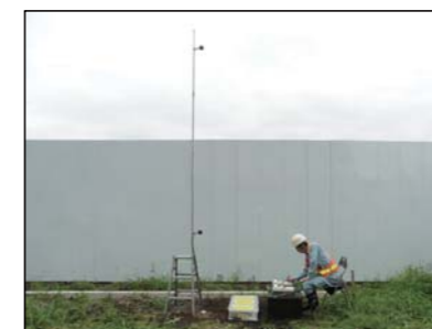
騒音、振動測定状況