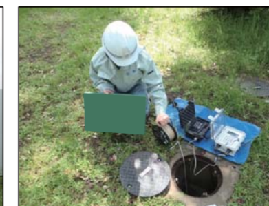
地下水位の観測状況