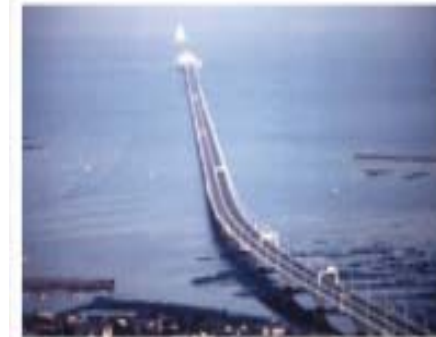
東京湾アクアライン 平成9年