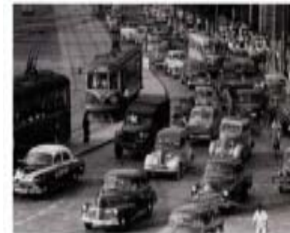
自動車であふれる日比谷交差点付近昭和28年頃