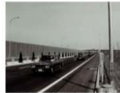
東関東自動車道 昭和56年