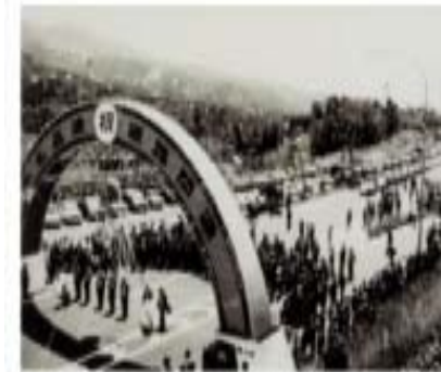
東名高速道路全線開通式 昭和44年