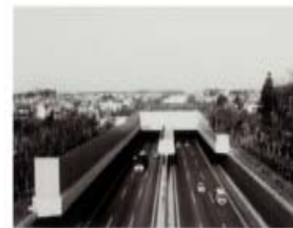
常磐自動車道(半地下構造三郷～柏間)昭和60年