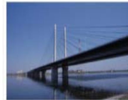
東京外かく環状道路(幸魂大橋) 平成6年