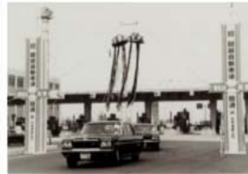
関越自動車道(高崎IC)昭和55年