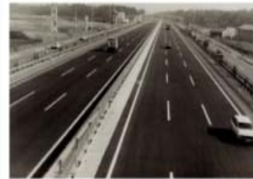
東北自動車道(浦和～岩槻)昭和55年