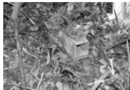
ネズミ類捕獲用のワナ (間口 8cm x 9cm の筒状のワナ)