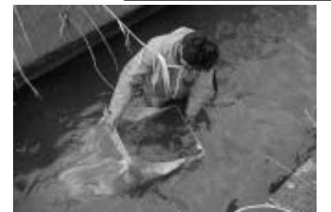
サーバーネットによる底生生物採集 (水生昆虫やエビ類等を採集します)