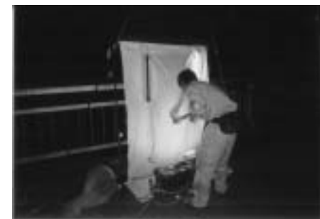
ライトトラップ (ライトを点灯し、集まってくる夜行性昆虫類を採集します。また、街灯のたくさんある場所では、街灯に集まる夜行性昆虫類を採集します。)