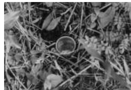
ベイトトラップ (地面に餌を入れた紙コップを埋めて、地上を歩く昆虫類を捕獲します。)