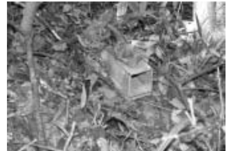
ネズミ類捕獲調査用のワナ (間口 8cm x 9cm の筒状のワナ)