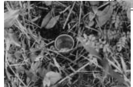
ベイトトラップ (地面に餌を入れた紙コップを埋めて、地上を歩く昆虫類を捕獲します。)