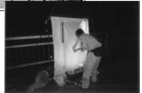
ライトトラップ (ライトを点灯し、集まってくる夜行性昆虫類を採集します。また、街灯のたくさんある場所では、街灯に集まる夜行性昆虫類を採集します。)