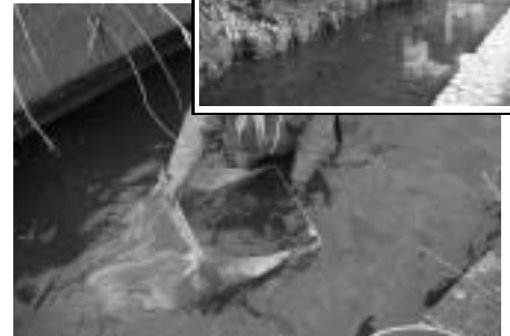
サーバーネットによる底生生物調査 (水生昆虫やエビ類等を採集します)