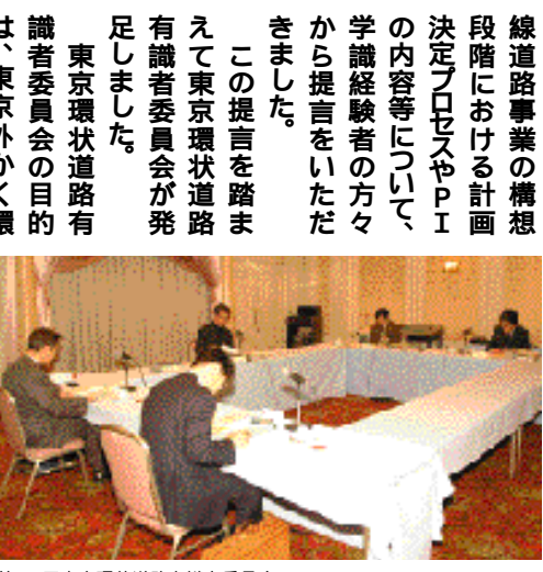
第13回東京環状道路有識者委員会

「最終提言」は全文をホームページで紹介しています。印刷した「最終提言」の郵送をご希望の方は、外環調査事務所(電話番号等は本ページ下段)までご連絡下さい。