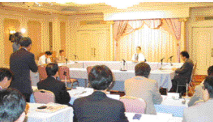
第9回委員会の審議の様子

「論点を絞った議論が必要ではないか」「運営が円滑でなかつたり、議論がかみ合わないこともあるが互いに初めての経験であり、必要なコストといった意見が出されました。