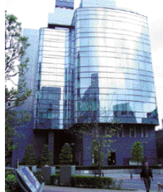
東京外かく環状道路調査事務所の入居ビル

時間 9:15~17:30(月~金) 住所 〒158-8580 東京都世田谷区用賀4-5-16 TEビル7階 TEL&FAX 03-3707-1491 (外環専用ダイヤル) e-mail gaikan@ktr.mlit.go.jp ホームページ http://www.ktr.mlit.go.jp/gaikan