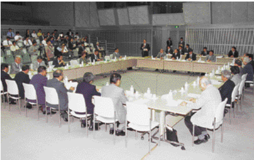
第一回PI外環沿線協議会の全景