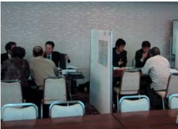
相談コーナーの様子（11月2日）