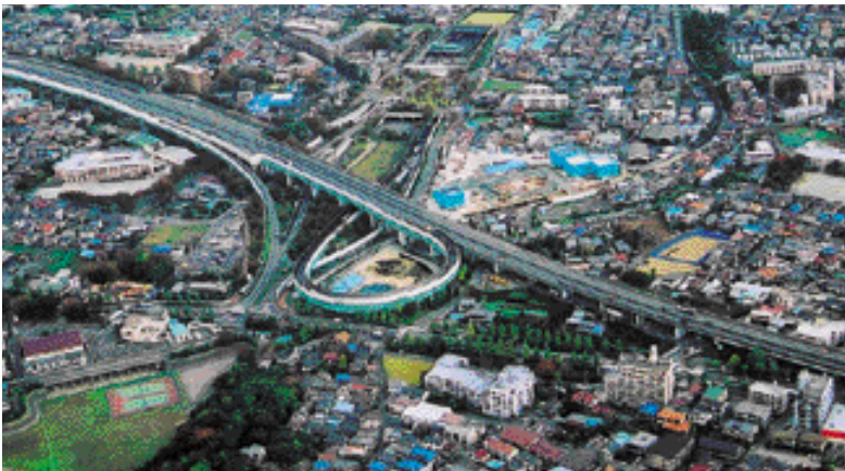
関越道と交差する外環大泉ジャンクション(平成13年11月撮影)

委員会は、東京外かく環状道 路(関越道、東名高速)の 計画において、PIプロセス の時間管理を念頭におき ながら、手続きの透明性、 客観性、公正さを確保す るため、公正中立な立場か らPIプロセスについて審 議、評価、助言することを 目的としています。