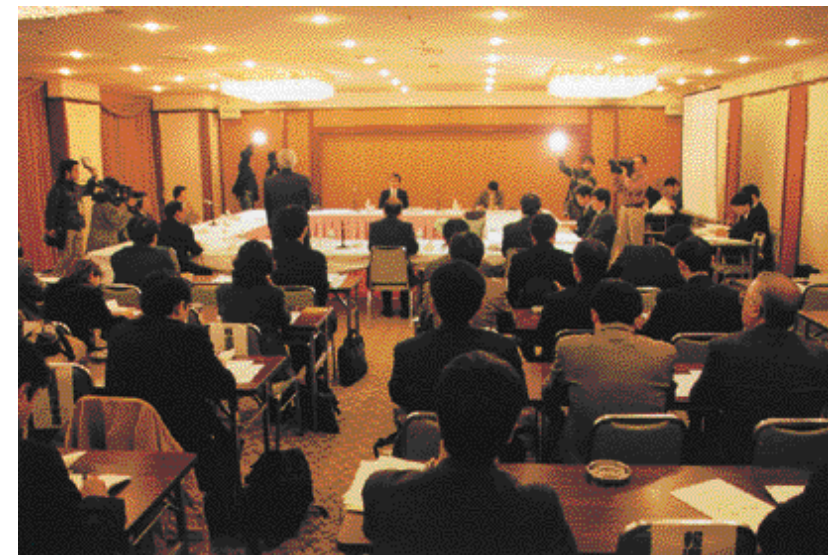
第1回委員会の審議の様

委員会は、東京外かく環状道 路(関越道、東名高速)の 計画において、PIプロセス の時間管理を念頭におき ながら、手続きの透明性、 客観性、公正さを確保す るため、公正中立な立場か らPIプロセスについて審 議、評価、助言することを 目的としています。