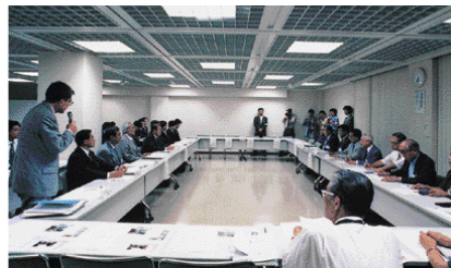
第4回住民団体との話し合い