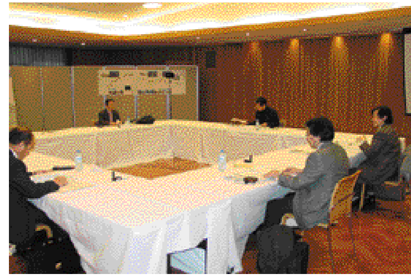
第2回委員会の審議の様

東京環状道路有識者委 員会第1回委員会は、5人 の委員が出席して平成13 年12月6日に開催されま した。