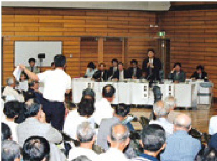
たたき台の説明会(平成13年5月28日、調布市立第八中学校)

平成14年1月発行 〔発行所〕 国土交通省関東地方整備局 川崎国道工事事務所 〒213-8577 神奈川県川崎市高津区梶ヶ谷2-3-3 TEL/FAX 044-888-6417(外環専用ダイヤル) http://www.ktr.mlit.go.jp/kawakoku/gaikan/