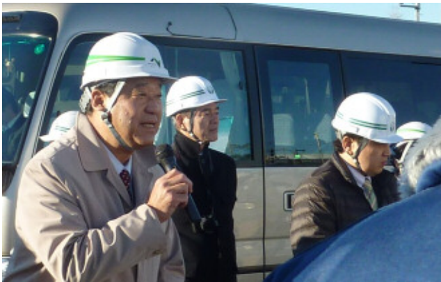
大熊委員長からのご挨拶