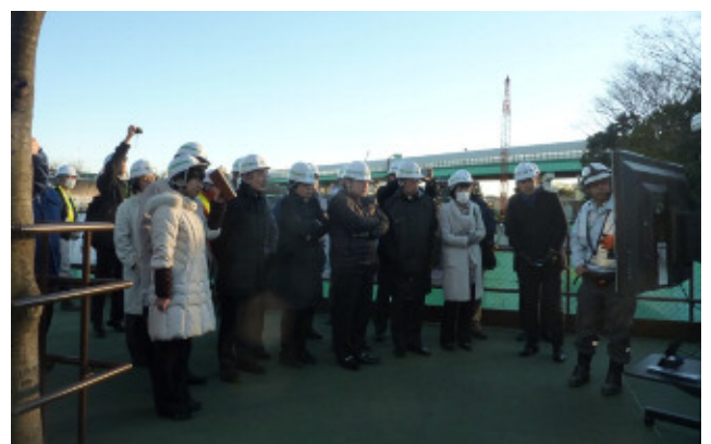
本線トンネル工事説明状況(立坑工事)