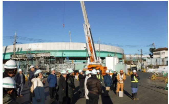
大泉JCTの工事説明状況①