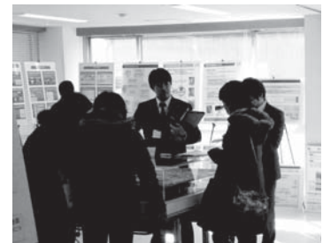
▲みなさんからのご相談やご質問には、担当者が個々に対応いたします。