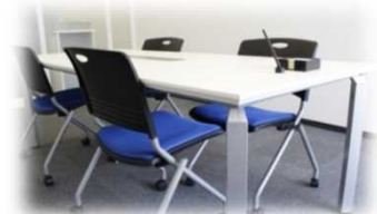
【相談ブース (イメージ)】

大泉本線(南行)・大泉本線(北行)シールドトンネルおよび大泉JCT Fランプ接続工事に関して、相談窓口を開設しておりますので、お気軽にご利用ください。