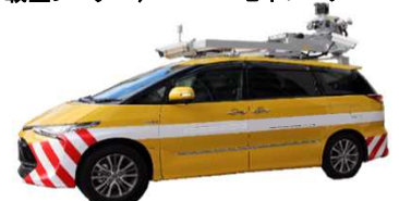
3D点群データ調査専用車両