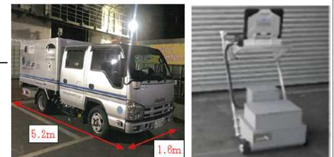
路面下空洞探査 (車載型レーダー)