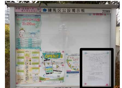
【掲示板設置イメージ】