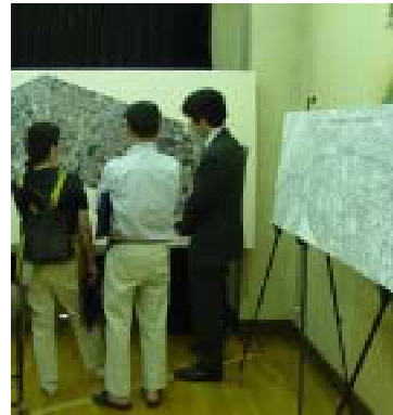
オープンハウスとは米国の公共事業などで行われている市民との対話手法の一つです。会場にパネル等を展示し、個別対話により個々のご意見を把握することが出来ます。