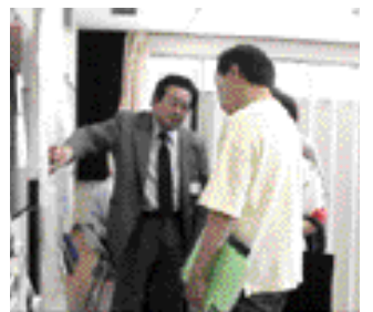
協議員が参加(6月29日・調布)