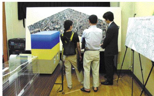
6月29日に調布市緑ヶ丘で開催された外環オープンハウス

東京外かく環状道路(東名高速)計画沿線地域の方々に対し、外環に関する資料・情報提供を行うことを目的に、PI外環沿線協議会及び地元区市、東京都、国土交通省による外環オープンハウスを開催しています。