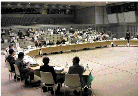
第23回PI外環沿線協議会

二酸化窒素の測定を行った結果、青梅街道沿いは高い数値を示している、また、生活に与える影響