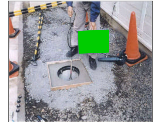
< 地下水位観測孔設置状況 >