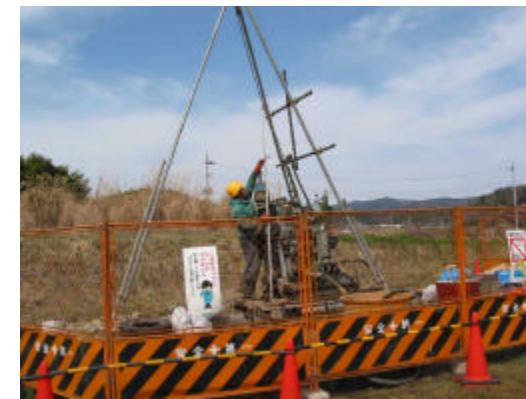
< ボーリング調査方法 >