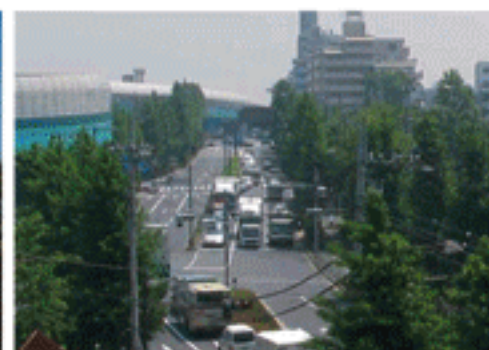
目白通り(大泉インターチェンジ付近)