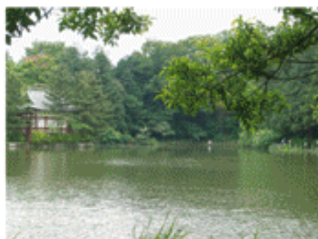
石神井公園(三宝寺池)