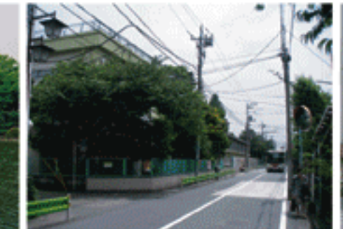
杉並区立桃井第四小学校(手前はバス通り)