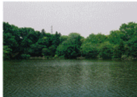
善福寺公園(善福寺池)