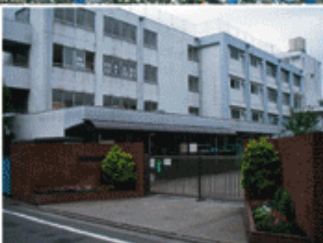
練馬区立三原台中学校