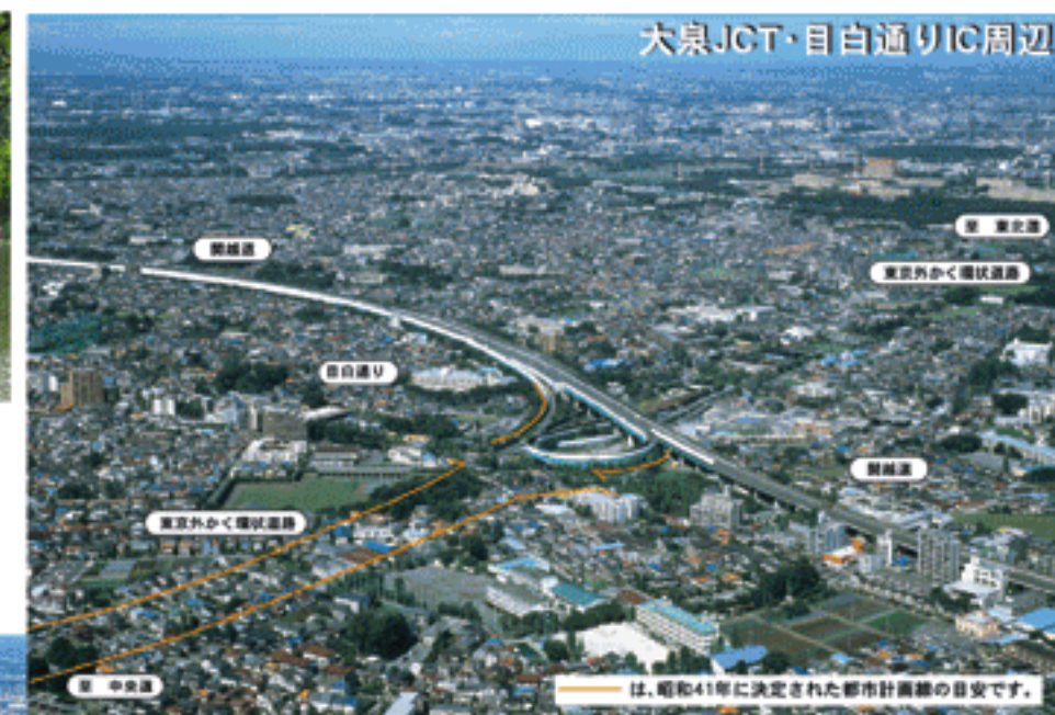
大泉JCT・目白通りIC周辺