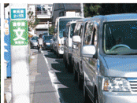
練馬区大泉付近の生活道路