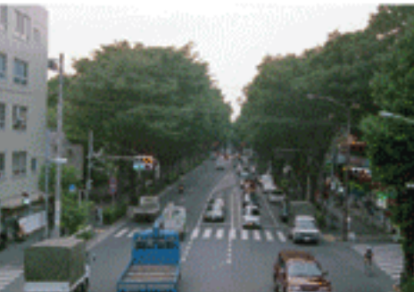
青梅街道(杉並区・練馬区境付近)