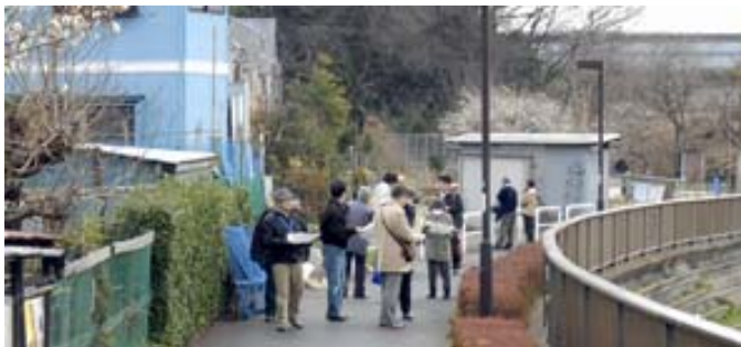
(写真4) グループに分かれて現地を見学