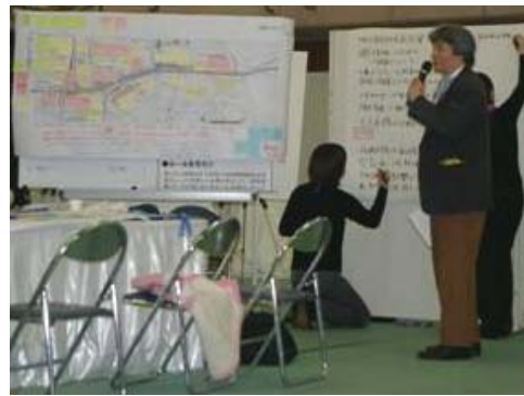
(写真3) 各グループの検討状況をグループ進行役から報告