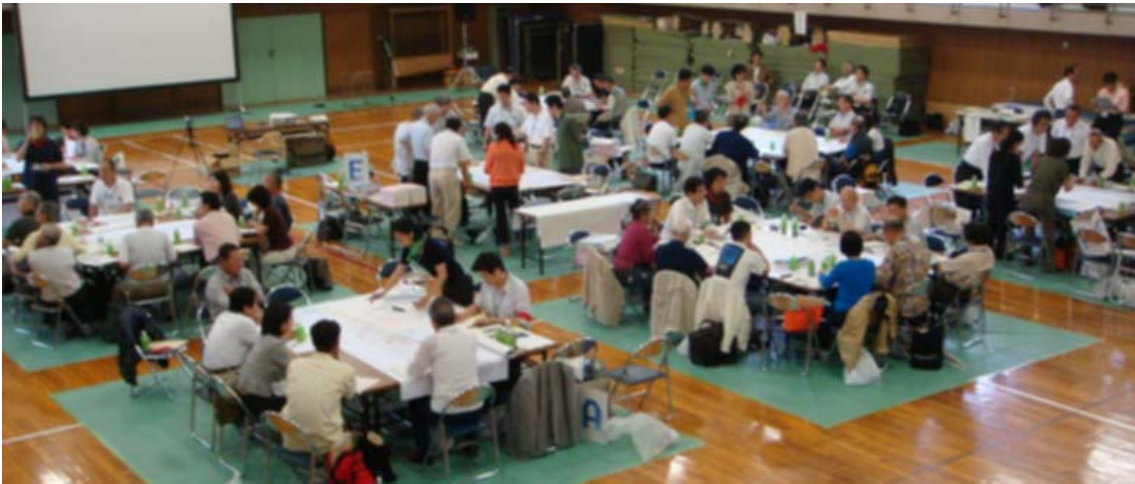
(写真1) 8つのグループに分かれて検討