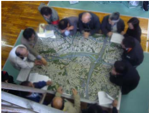
(写真2) 模型を見ながら技術的な助言役の説明により計画内容や周辺状況等を確認