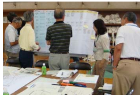
6 (写真6) 計画の要素ごとに、どのように課題を解決できるか検討