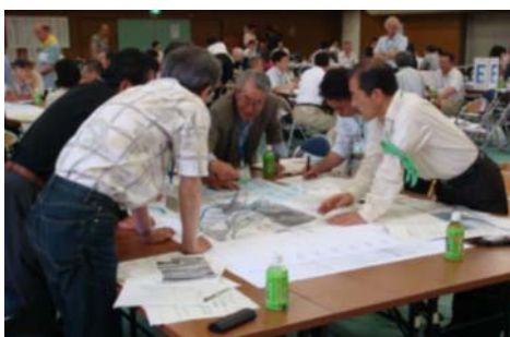
(写真5) 図面の資料を使って検討