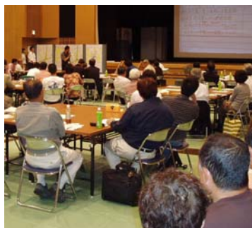
(写真3) 各グループの発表係が発表を行いました