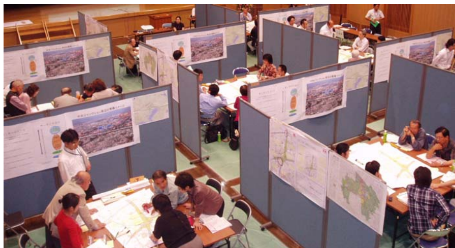
(写真1) 15のグループに分かれて検討