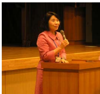
(写真2) 主催者を代表して清原三鷹市長より挨拶がありました