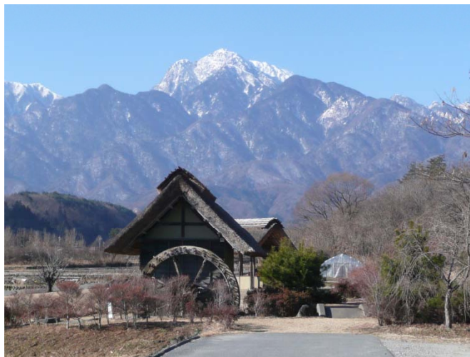
甲斐駒ヶ岳も望めます (撮影:平成23年1月13日)