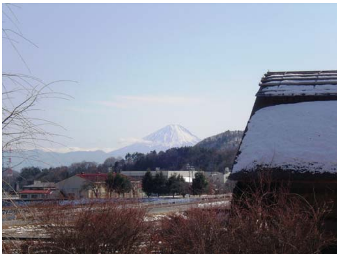
水車の里公園からみる富士山 (撮影:平成23年2月13日)

舞鶴緑地広場からは、富士山を背景に武川町の田園風景と大武川を見渡すことができます。この広場は、枯山水式の舞鶴庭園として整備されています。また、この広場の近くには、水車のある小さな公園「水車の里公園」があり、地元住民の憩いの場として、また富士山と甲斐駒ヶ岳の双方を望む絶好のロケーションから写真撮影やスケッチ等のスポットとなっています。