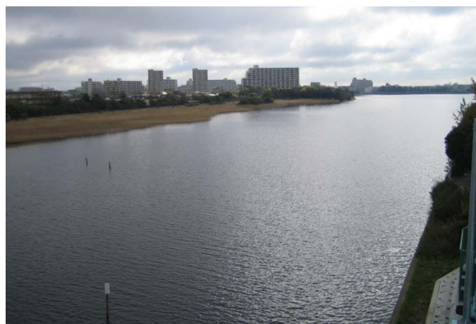
歩道橋から望む谷津干潟