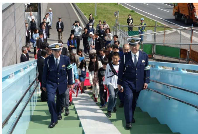
関係者による渡り初め