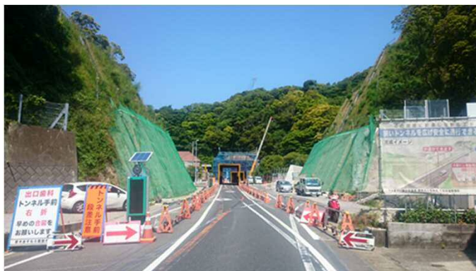
①久保トンネルの施工状況 (H28.5現在)