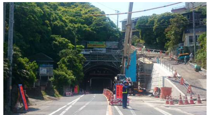
②坂下トンネルの施工状況 (H28.5現在)