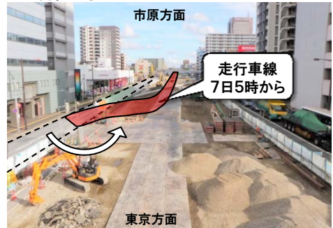
市役所前歩道橋から市原方面を望む