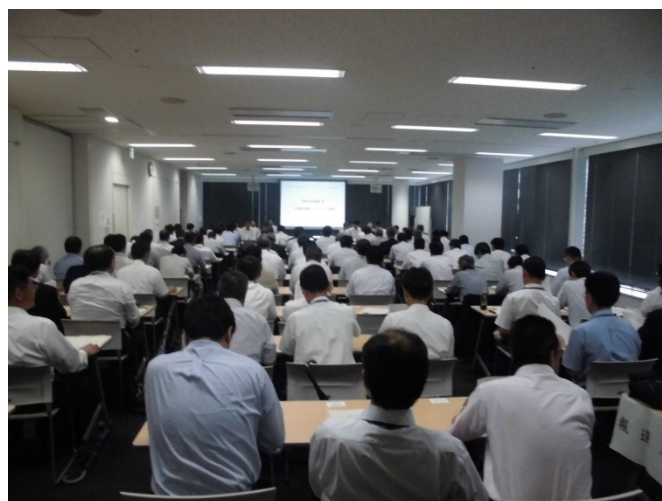
平成28年度第1回道路メンテナンス会議の実施状況 (H28.6.28)