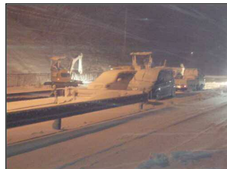
国道127号 富津市鶴岡 除雪状況