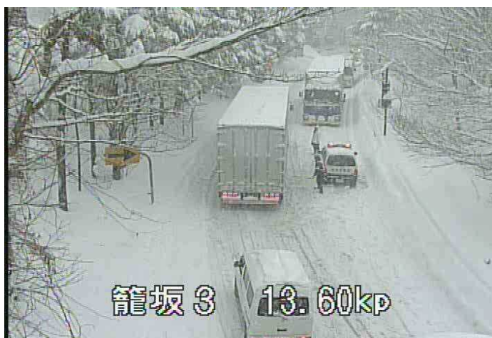
山梨県 国道138号の道路状況(H26年2月)

◆ 県外の豪雪地帯にお出かけの際は、気象状況を確認のうえ、冬用タイヤの装着やタイヤチェーンを携帯しましょう。