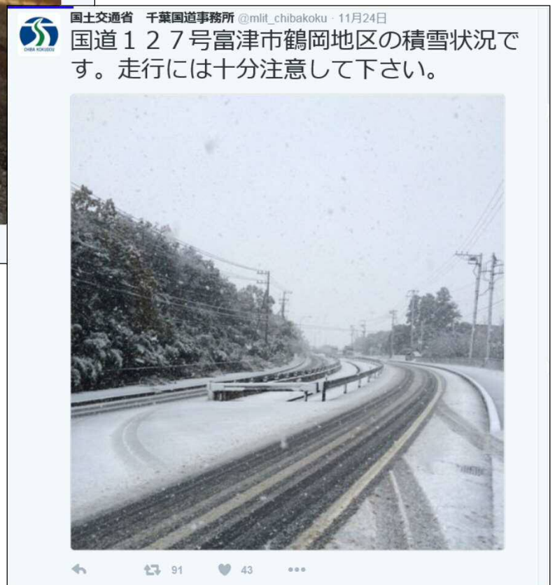
平成28年11月24日 国道127号 富津市鶴岡地区