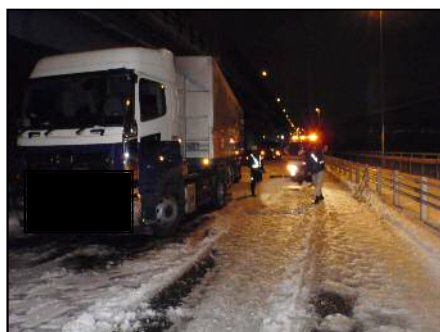
国道357号 海老川大橋 積雪により立ち往生車両状況