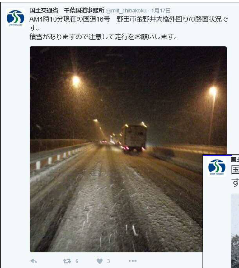
平成28年1月17日 国道6号 野田市金野井大橋