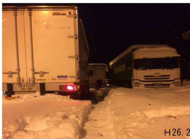
群馬県 国道18号の道路状況(H26年2月)