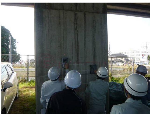
現地点検の状況 (鉄筋探査)