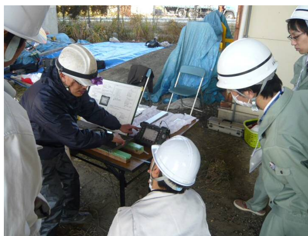
現地点検の状況 (超音波探傷試験)