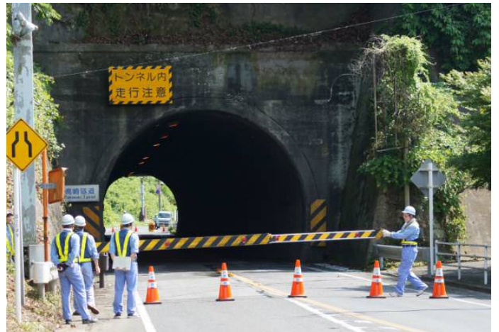
(遮断機の操作訓練の様子)