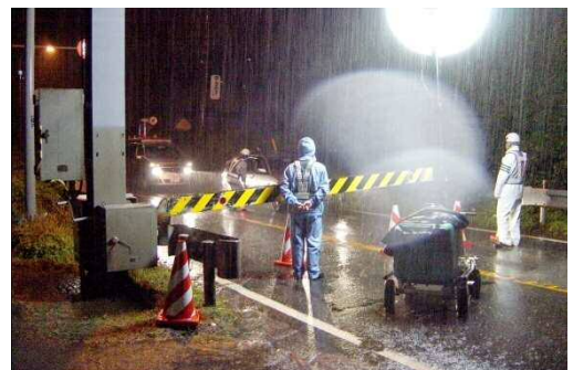
平成18年12月26日豪雨時の通行止めの様子