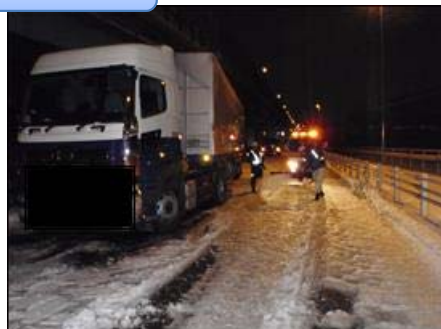
国道357号 海老川大橋 積雪により立ち往生車両状況