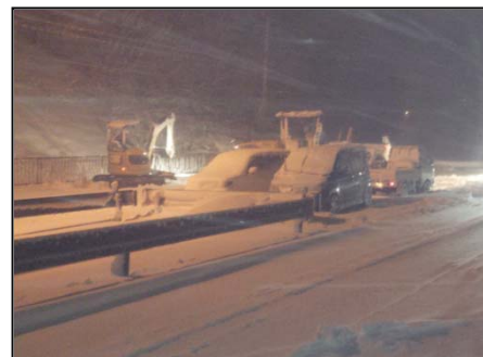
国道127号 富津市鶴岡 除雪状況

千葉国道事務所 ホームページ： http://www.ktr.mlit.go.jp/chiba/ 公式ツイッター情報： https://twitter.com/mlit_chibakoku