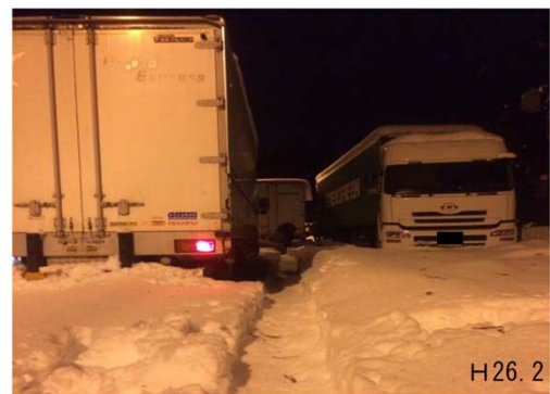
群馬県 国道18号の道路状況(昨年2月)