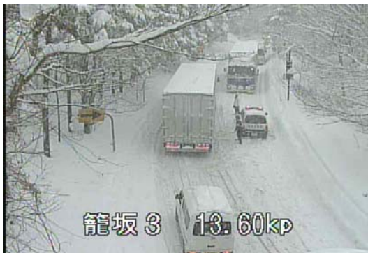
山梨県 国道138号の道路状況(昨年2月)

◆ 県外の豪雪地帯にお出かけの際は、気象状況を確認のうえ、冬用タイヤの装着やタイヤチェーンを携帯しましょう。