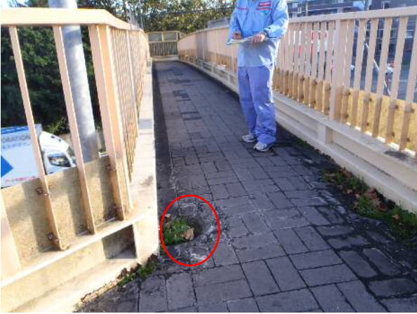
点検状況①（歩道橋の排水詰まり）