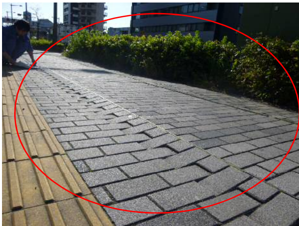
点検状況②（舗装の段差）