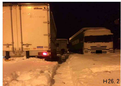
群馬県 国道18号の道路状況(今年2月)