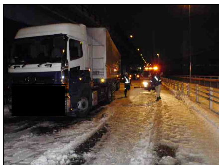
国道357号 海老川大橋 積雪により立ち往生車両状況