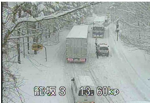
山梨県 国道138号の道路状況(今年2月)

◆ 県外の豪雪地帯にお出かけの際は、気象状況を確認のうえ、冬用タイヤの装着やタイヤチェーンを携帯しましょう。