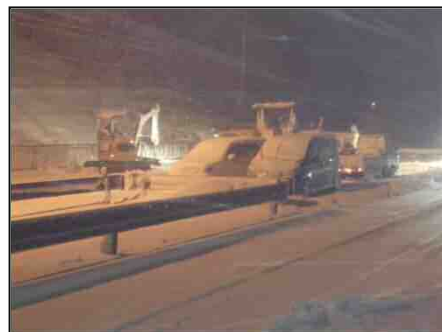
国道127号 富津市鶴岡 2月14日の除雪状況

千葉国道事務所 ホームページ： http://www.ktr.mlit.go.jp/chiba/ 公式ツイッター情報： https://twitter.com/mlit_chibakoku