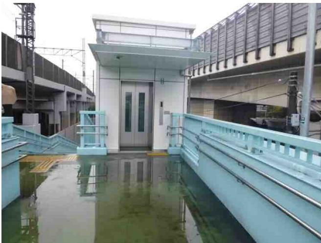
【① 東京方面側 2階】