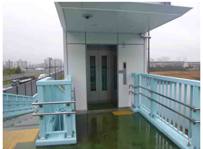
【② 千葉方面側 2階】