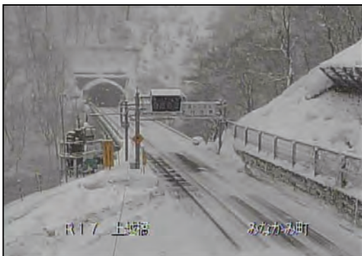
群馬県 国道17号の道路状況(今年1月)

◆県外の豪雪地帯にお出かけの際は、気象状況を確認のうえ、冬用タイヤやタイヤチェーンを準備しましょう。