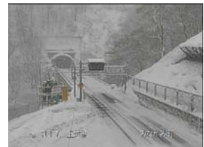
群馬県 国道17号の道路状況