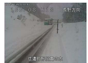
長野県 国道18号の道路状況