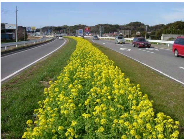
「菜の花」の開花状況(2月頃)