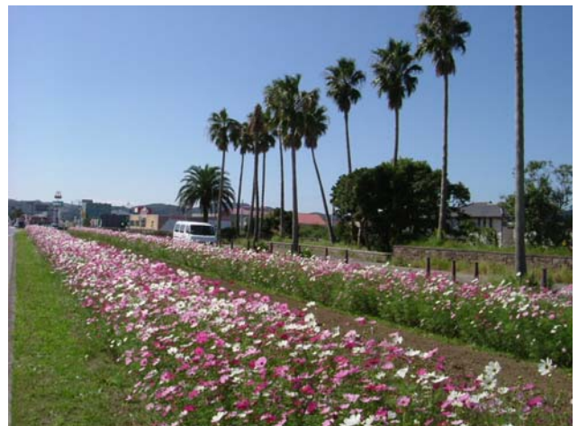
「コスモス」の開花状況(10月頃)